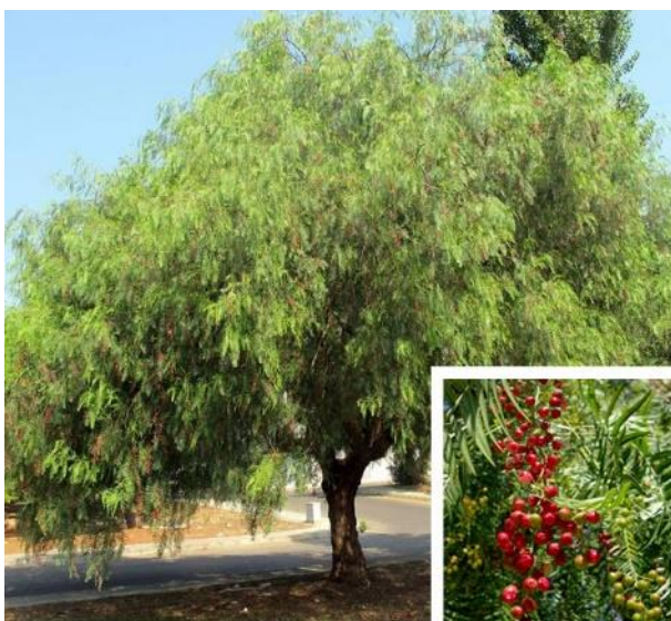
Pimenteira-bastarda ( Schinus molle ) Não autóctone, folha persistente