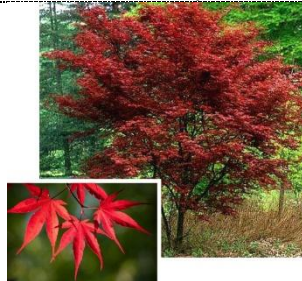
Ácer-do-Japão ( Acer palmatum ) Não autóctone, folha caduca