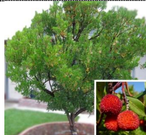
Medronheiro ( Arbutus unedo ) Autóctone, folha persistente