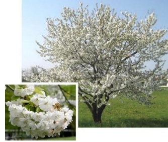
Cerejeira-brava ( Prunus avium ) Autóctone, folha caduca