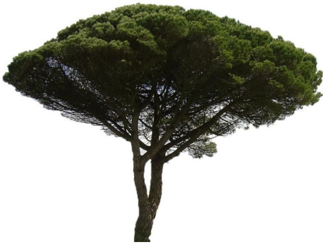
Pinheiro-manso ( Pinus pinea ) Autóctone, folha persistente