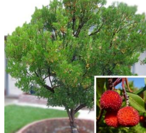
Medronheiro ( Arbutus unedo ) Autóctone, folha persistente