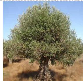
Zambujeiro ( Olea europaea var. sylvestris ) Autóctone, folha persistente